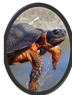
Tortue des bois

La propriété Faucher détient une valeur écologique indéniable et on y retrouve deux espèces vulnérables à la récolte au Québec : la cardamine carcajou et la matteuccie fougère-à-l'autruche. Son grand intérêt écologique est cependant lié à ses ruisseaux et à ses milieux humides utilisés par la tortue des bois, une espèce menacée au Canada et vulnérable au Québec. M. Faucher, pour sa part, a eu l'occasion d'y observer de nombreuses espèces au fil des ans. « Il y a beaucoup d'animaux sauvages : des cerfs de Virginie, des orignaux, des renards, des lièvres... » On trouve également sur la propriété une source d'eau pure qui fait la fierté de M. Faucher : « Il y a une source d'eau fraîche où j'allais souvent quand j'étais jeune, j'y ai de nombreux souvenirs. »