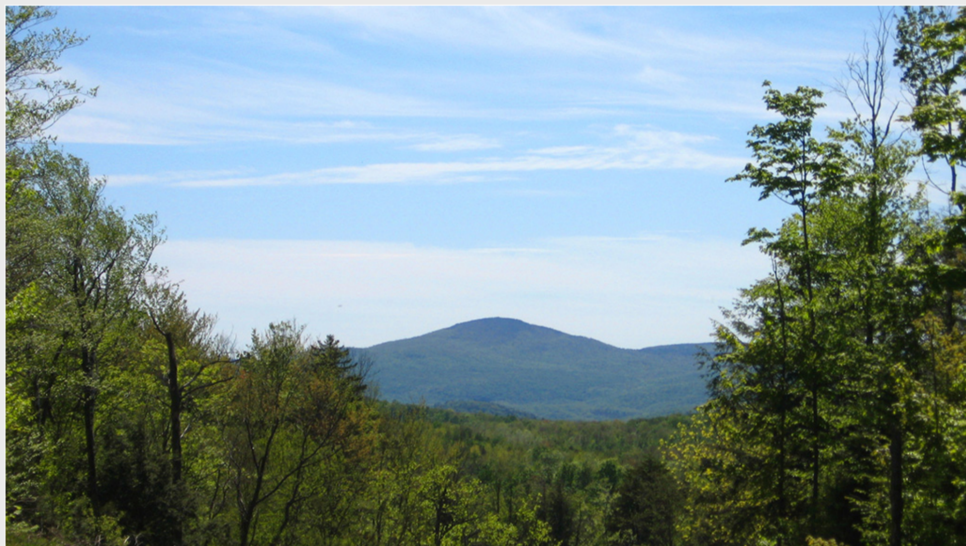
Mont Foster

RECONNAISSANCE. Le travail de Corridor appalachien dans la protection du mont Foster a retenu l'attention au 27 e Gala des Prix d'excellence en environnement des Cantons de l'Est, le 26 février dernier.