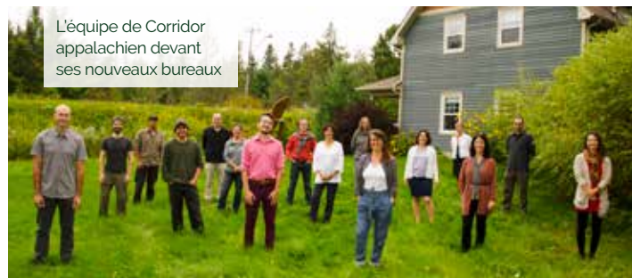
L'équipe de Corridor appalachien devant ses nouveaux bureaux

Merci à tous les donateurs qui ont contribué à notre campagne de levée de fonds pour l'acquisition de notre nouveau refuge à Eastman! Grâce à vous, nous avons maintenant un espace beaucoup mieux adapté aux besoins de notre équipe grandissante et en plein essor!