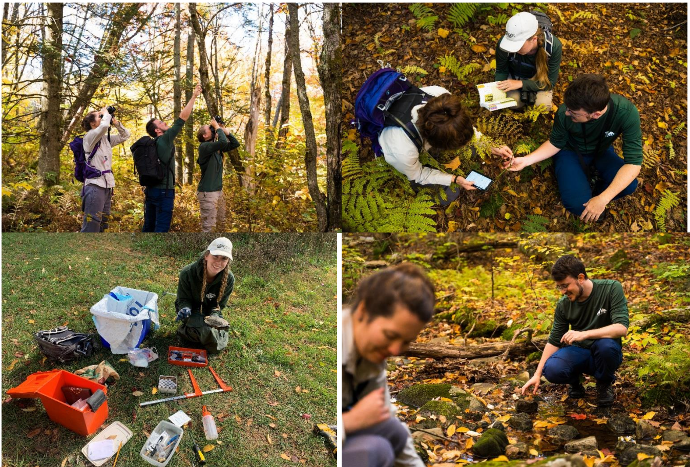
Équipe permanente de Corridor appalachien en acquisition des connaissances